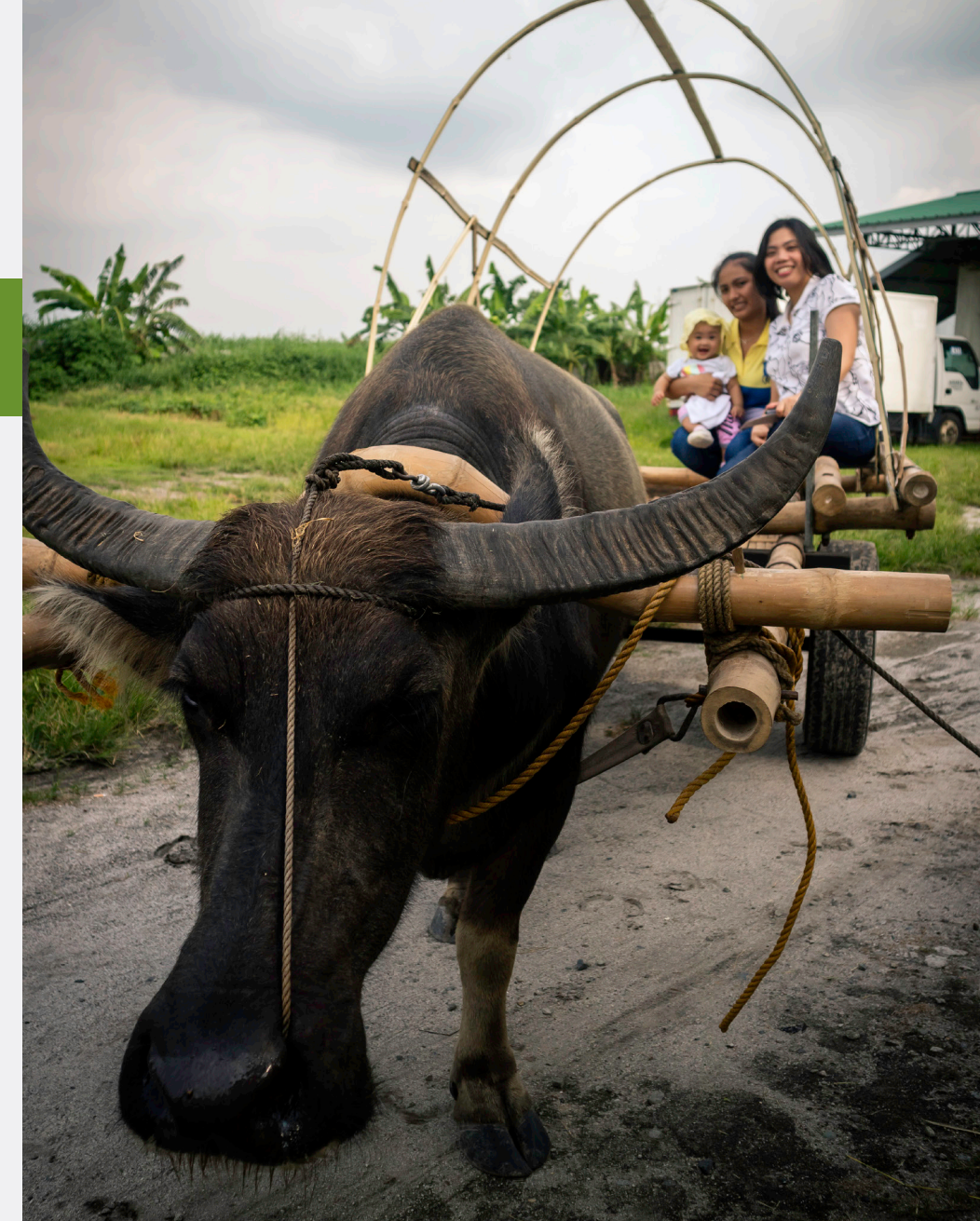
Isang kakaibang karanasan ang hatid ng EDL farm sa transportasyon gamit ang kariton na hinihila ng native na kalabaw.

Maliban sa PCC, kabilang din sa mga kabalikat na ahensiya ng gobyerno na umaasiste sa EDLAFI ay ang National Dairy Authority (NDA), Agricultural Training Institute (ATI), DOT, at Villar SIPAG.