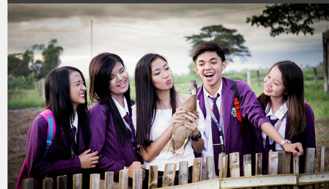
Karamihan sa mga bumibisita sa EDL farm ay mga kabataan na tuwang-tuwa sa kanilang pamamasyal.