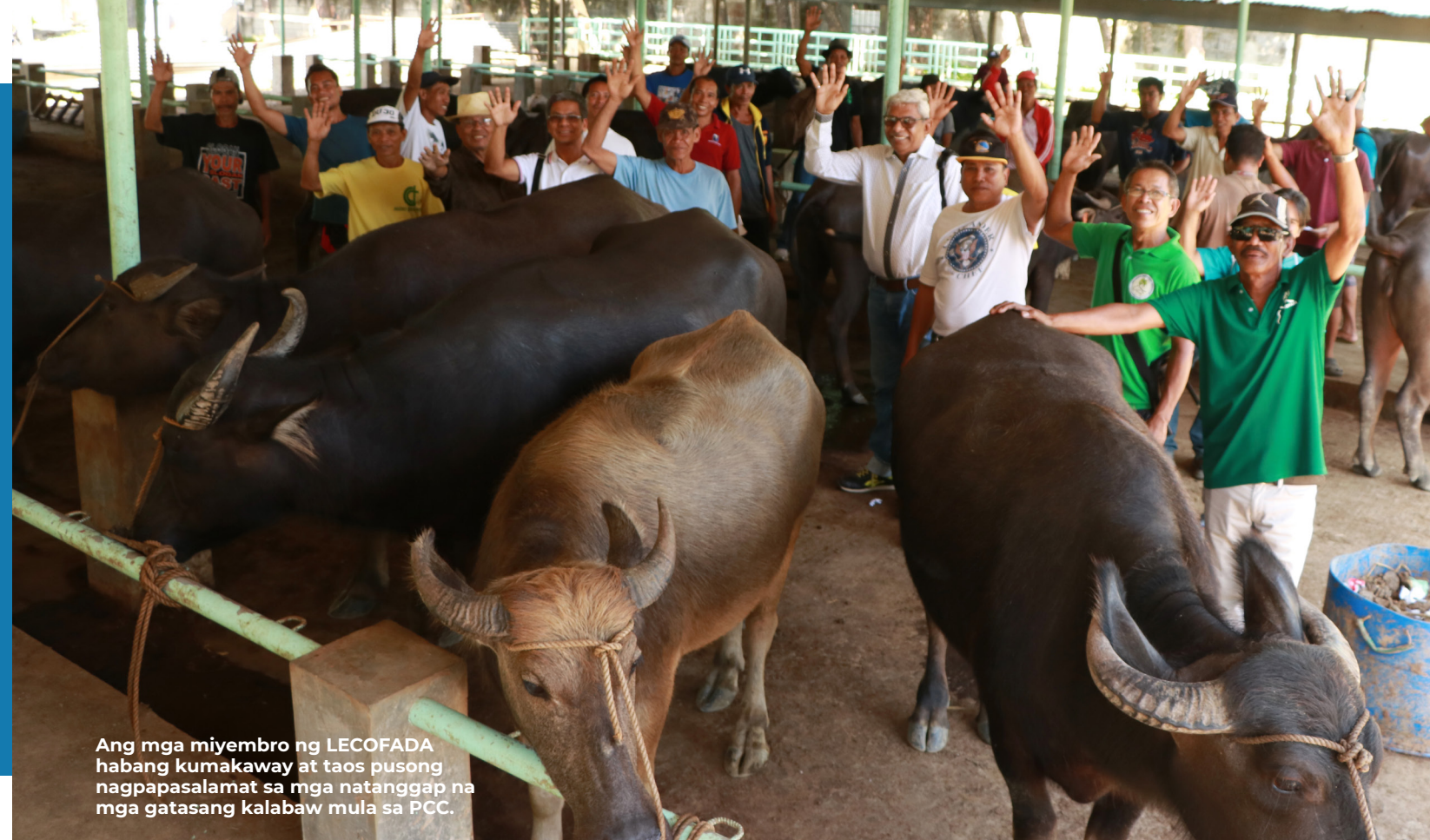
Ang mga miyembro ng LECOFADA habang kumakaway at taos pusong nagpapasalamat sa mga natanggap na mga gatasang kalabaw mula sa PCC.

-Dir. Arn Granada Center chief, PCC sa WWSU